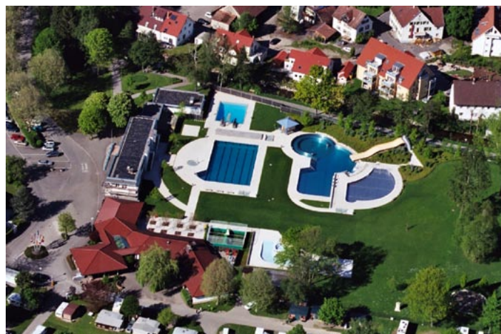
Luftaufnahme des Dreisambades und Blick von der Rutsche

Der umfangreiche und klar strukturierte Beratungsbericht weist die allgemeinen Rahmenbedingungen, den baulichen und technischen Istzustand der Gebäude sowie den bisherigen Strom-, Heizenergie- und Wasserverbrauch aus. Nachfolgend wurden verschiedene bauliche und technische Verbesserungsmaßnahmen vor allem im Bereich der Wärmeversorgung hinsichtlich des damit verbundenen Energieeinsatzes, der Investitionen und Wirtschaftlichkeit sowie der